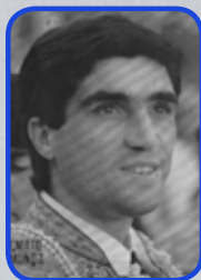
Emilio Muñoz (Torero)

Nació en El Puerto de Santa María, el 27 de agosto de 1953. Tomó la alternativa en la plaza de su ciudad natal el 18 de julio de 1971. La confirmación de su doctorado fue el 17 de mayo de 1972, en Madrid. Ha salido 55 veces por la puerta grande de El Puerto de Santa María, actualmente tiene el récord en el coso portuense. Ha lidiado más de 1000 toros y ha toreado en prácticamente todas las plazas del mundo. Obteniendo grandes triunfos como en América, Francia y España. Ha toreado la corrida Goyesca de Ronda en dos ocasiones en 1971 y 1979.